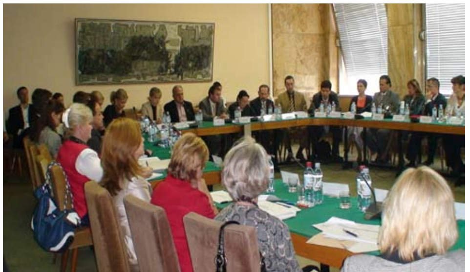
Консултативни процес – чланови Пројектне групе

За израду Акционог плана била је задужена Пројектна група за израду Акционог плана за период 2009–2012, састављена од представника свих носилаца послова управе, док је за израду дела плана који се односи на развој е-управе и модернизацију државне управе била задужена Посебна радна група за е-управу. Процес израде Акционог плана ►